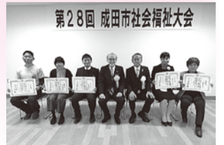
会長表彰・社会福祉施設団体役員職員、社会福祉協力功労者の皆様