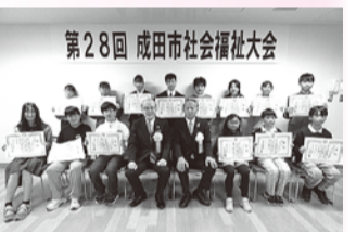
福祉作文・標語コンクール 優秀作品受賞者の皆様