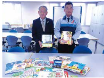
十和運送株式会社様(右)