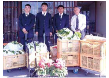
千葉県立下総高等学校様(左3名)