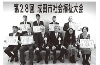
会長感謝状・団体の皆様