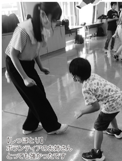
【しっぽとり】 ボランティアのお姉さん とっても強かったです