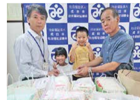
千葉県退職公務員連盟 印旛支部様