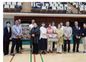
千葉県ママさんバレーボール連盟様