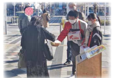
令和4年度街頭募金 成田国際高等学校、中台中学校、中台地区社会福祉協議会の皆様にご協力いただきました。

皆様からお寄せいただいた募金は、成田市内の準要保護世帯の児童が学用品などを購入する際の補助、養護施設や障がい児施設に入所している児童・養護老人ホームに入所している高齢者への見舞金、市内の民間福祉施設、地区社会福祉協議会が行う事業費の一部として配分され、活用されています。