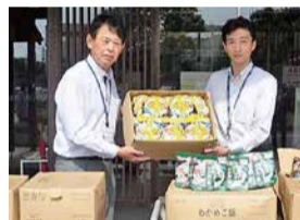
株式会社ジャムコ様