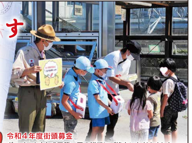
令和4年度街頭募金 ボーイスカウト成田第一団の皆様にご協力いただきました。