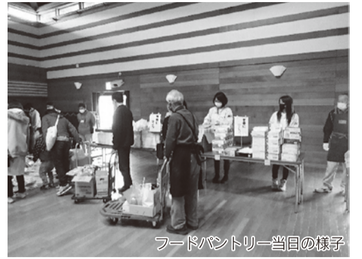
フードパントリー当日の様子