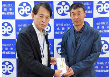
成田市下総建設業協会様