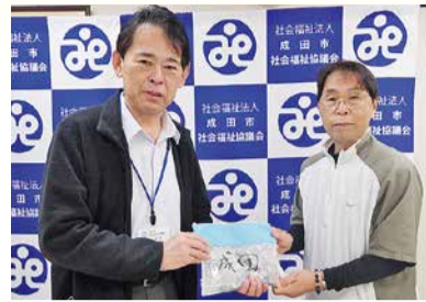
理容室しゃれ床サンスカイ様