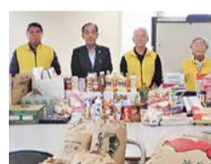
大利根地区社協高岡支部様

スッキリきれいで快適生活! 日頃手が回らない頑固な汚れや隠れた 汚れもしっかりクリーニングいたします。