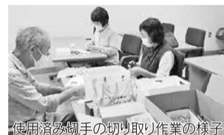
使用済み切手の切り取り作業の様子

※②の段階では、2か月に1度、個人ボランティアの方々が保健福祉館に集まり、ボランティアセンターで収集した使用済み切手の切り取り作業をしています。