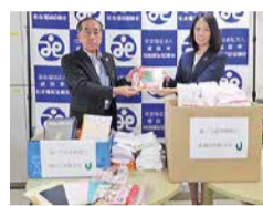
第一生命保険(株)労働組合様