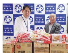
成田ロータリークラブ様