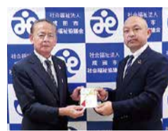
ナリコーセレモニー チャリティーカルチャースクール 参加者一同様