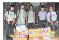
国際医療福祉大学 成田キャンパス様