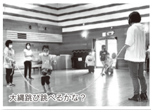
大縄跳び跳べるかな?