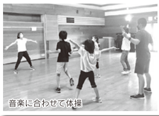
音楽に合わせて体操

最後は参加賞としてお菓子とアイスをプレゼント。コロナ禍のため感染拡大防止の対策を行った上で開催となりましたが、楽しい一日となりました。ご参加いただいた皆様、本当にありがとうございました。