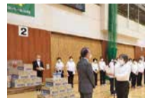
千葉県ママさんバレーボール連盟様