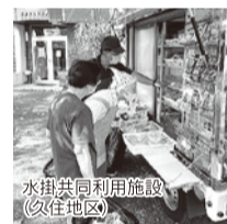
水掛共同利用施設(久住地区)

SCは今後も地域で自立した生活が送れる仕組みづくりの一環として、買い物支援の体制整備に携わっていきます。