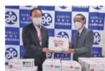
日本航空株式会社 成田空港支店様