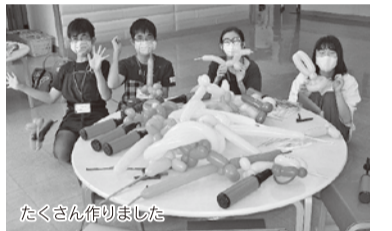
たくさん作りました

■講座終了後には、参加者10名中8名が個人ボランティアとして登録しました。これからも、学校が休みの時などに活動を続けるとのことです。今後は、バルーンを検診等で保健福祉館を訪れた子どもたちへプレゼントしたり、病院等で子どもたちにバルーンを作るボランティアをしたりと、活動の幅が広がっていくことと思います。