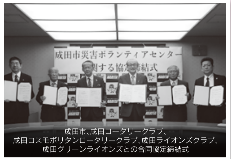
成田市、成田ロータリークラブ、成田コスモポリタンロータリークラブ、成田ライオンズクラブ、成田グリーンライオンズとの合同協定締結式

このようなことから、成田市との協定は、災害が発生し又は発生するおそれがある場合の災害ボランティアセンターの設置や、被災情報の共有、資機材の確保などについて、各団体とは、被災者の支援にあたり、ボランティア活動への参加協力、センター運営スタッフの派遣、運営に必要な資機材の提供などのご支援をいただくための協定を締結し、連携を図っていくものです。