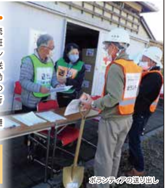
ボランティアの送り出し

また、コロナ禍であることから、消毒、換気、三密の回避などに十分配慮した訓練としました。