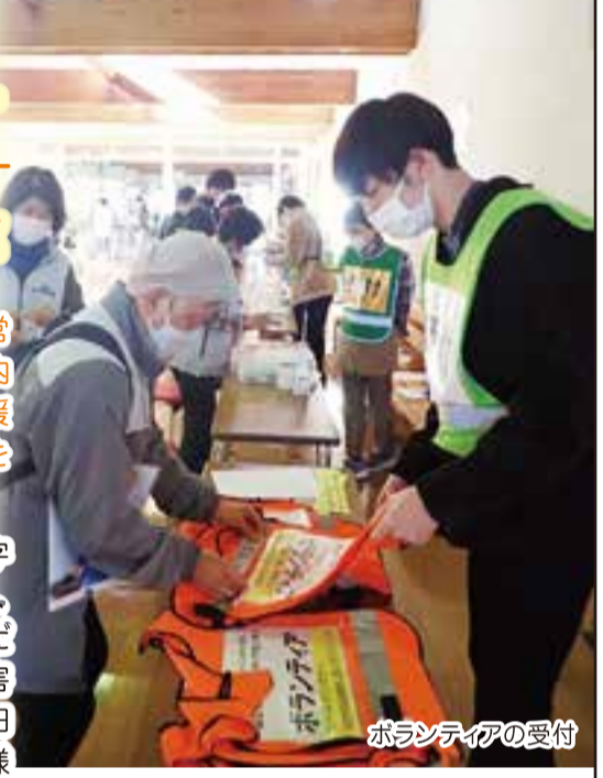
ボランティアの受付

11月27日(土)、成田市保健福祉館において、災害ボランティアセンター(以下、災害VC)立ち上げ・運営訓練を実施しました。今回の訓練は、大型の台風が房総半島に上陸後、千葉県北西部を通過し、成田市内でも建物被害や停電が発生する中、多くの市民が避難所に避難し、市内各地域から、ボランティアの支援要請が届いている想定のもとで、かけつけたボランティアを被災地や被災者へ円滑につなげていくことをテーマに、各班の実践的な連携にポイントを絞り実施しました。