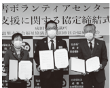
成田青年会議所との協定締結式 (富里市社会福祉協議会と合同開催)