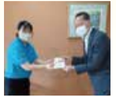
成田エナジー株式会社様