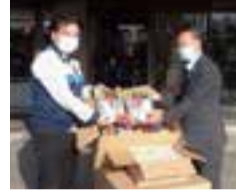
十和運送株式会社様