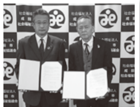
成田市農業協同組合と協定を締結しました