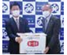
第一生命保険株式会社 労働組合様