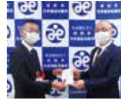
ナリコーセレモニー チャリティカルチャースクール 参加者一同様