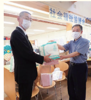
千葉県退職公務員連盟 印旛支部様