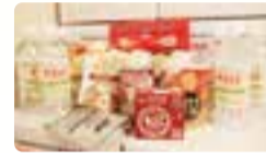
シンガポール航空様