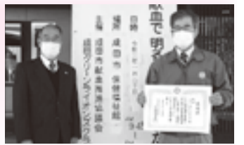
成田グリーンライオンズクラブ様

また、福祉作文・標語コンクールにおいては、市内の小、中、高校より多数の応募の中から選ばれた優秀作品を表彰し、保健福祉館内で「福祉作品展」を開催しました。