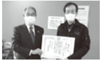
成田市手話サークル「こぼとの会」様