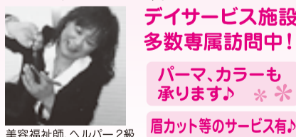
美容福祉師、ヘルパー2級

※訪問中は電話に出られない場合もあります。留守番電話に伝言頂ければ、こちらよりご連絡致します。