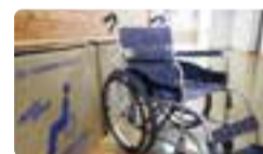
(株)メタルワン・スチールサービス様