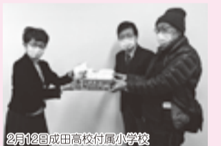
2月12日成田高校付属小学校