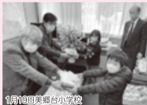
11月19日美郷台小学校

「地域の人たちが一つひとつついでに作った竹笛は大きさも音色も様々です。未永く子どもたちの成長を見守ってくれることを願っています。」