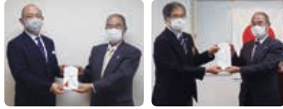
ナリコーセレモニーチャリティーカルチャースクール参加者一同様 成田グリーンライオンズクラブ様