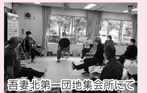
吾妻北第一団地集会所にて

現在サポーター会には20名の会員がおり、市内全域の多くの方が会員となって、指導役として活躍いただくものです。